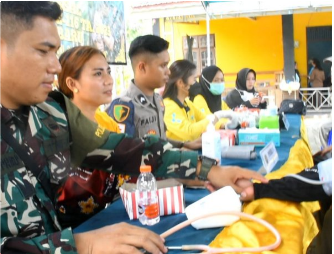
Satgas TMMD Ke-116 Kodim 1004/Kotabaru Buka Pengobatan Gratis

KOTABARU-Bekerjasama dengan Dinas Kesehatan Kabupaten Kotabaru dan Polkes 06.09.16 Kotabaru serta Kesehatan Polres Kotabaru, Satgas TNI Manunggal Membangun Desa (TMM) ke-116 Kodim 1004/Kotabaru membuka